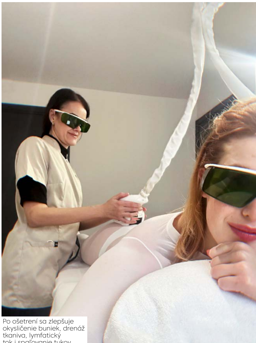
Po ošetrení sa zlepšuje okysličenie buniek, drenáž tkaniva, lymfatický tok i spaľovanie tukov.

dySculpt. Objednala som sa do Eveclinic v centre Bratislavy, kde mi dali expresný termín a ukázkovo sa o mňa postarali hneď po príchode. Milá sestrička si ma zobrala do parády a vysvetlila mi všetko, čo sa bude diať. Najviac som sa bála toho, či to nebude bolieť, keďže moja tolerancia bolesti je na bode mrazu, ale bola som príjemne prekvapená. Prístroj mi nasadili na zadok, lebo ten považujem za svoju najproblematickejšiu partiu, a spustili výboje. Nič, čo by sa nedalo vydržať a keď som počula, že nasledujúcich 30 minút budem len ležať a oddychovať a napriek tomu bude výsledok procedúry ekvivalentom toho, akoby som urobila 20-tisíc sed-lahov alebo drepov, sa mi chcelo plakať od radosti. Opäť raz som sa v duchu poďakovala za to, v akých časoch žijem a za všetky vymoženosti, ktoré nám svet ponúka. Po procedúre treba vypíť veľa vody a necvičiť aspoň jeden deň, aby sa svaly nepreťažili a výsledok sa nezmaril. Veľmi rada som sa obeťovala a po každom sedení som si dala rest day bez cvičenia. Na partiách, ako sú brucho a zadok, pomáha BodySculpt veľmi efektívne znižovať tukovú vrstvu a osobne môžem potvrdiť, že už po prvom sedení som mala pocit pevnejšej pokožky a zdvihnutejšieho zadku. Podľa lekárskeho štúdií je nárast svalovej hmoty 16 percent a strata tuku 19 percent po piatich aplikáciách. Ja som sa rozhodla absolvovať šesť ošetrení, lebo istota je guľomet a môžem odporučiť každému, kto si chce dopomôcť ku krajšiemu telu. V kombinácii s pravidelným cvičením výsledok stojí za to!