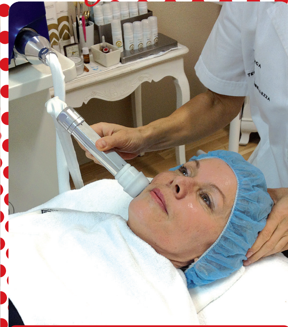
Pri ošetrení rádiomezolift